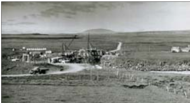
Brúargerð 1949. Bærinn Þjótandi til hægri.