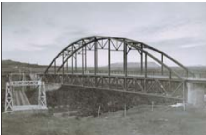
Gömul og ný brú, sennilega á vígsludegi 10. nóvember 1949.

dýrari, enda ekki gert ráð fyrir svo mikilli umferð, að þess væri þörf. Burðarþol brúarinnar er miðað við að tveim vögnum, öðrum 25 tonna þungum, en hinum 9 tonna, sé ekið um hana samtímis og með litlu bili milli þeirra. Einnig er burðarþol miðað við, að brúin beri 350 kg þunga á hvern fermeter brúargólfs, eða 120 tonn dreyfð jafnt yfir aðalhafið. Má því aka þéttskipaðri röð bifreiða eftir allri brúnni.