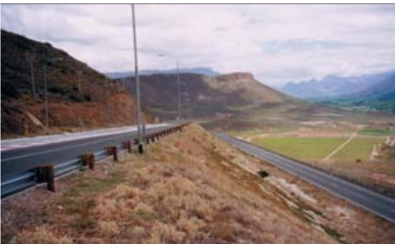
Vegarkafli í Riverdale þar sem slys voru áður tíð en hefur nú verið lagfærður.

Þróun umferðar: Hlutfall vegfarenda sem aka vegi í umsjá vegagerðarinnar samanborið við heildarumferð.