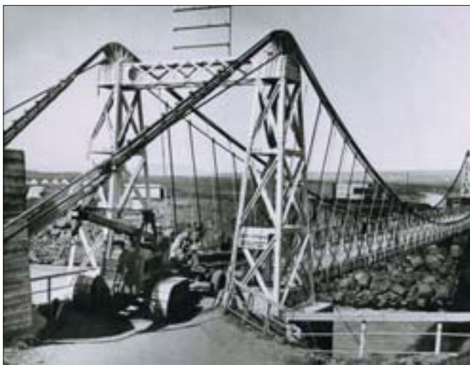
Þessi brú var byggð 1895 en myndin er tekin þegar smíði nýrrar brúar stóð yfir.

Tilhögun brúarinnar er þessi: Í aðalhafi er 83,0 m stálgrindabogi, en við báða brúarsporða eru 12,0 m landhöf á stálbitum, en öll lengd brúargólfs verður 109,0 m. Gólf brúar er úr járn-bentri steypu og er akbrautin 4,1 m á breidd, en milli handriða eru 4,9 m og er því breiddin rífleg fyrir hin stærstu ökutæki, en ekki nægileg til þess að bifreiðar mætist á brúnni. Þá hefði brúin þurft að vera 1,9 m breiðari og því all miklu